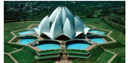
2. La fleur de lotus (le padma)